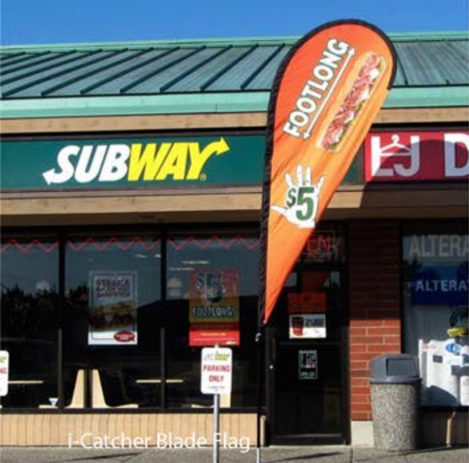
i-Catcher Blade Flag