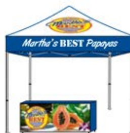
Cubierta personalizada con picos blancos, azules. Cenefas con logo y tendencia azul Lienzo frontal de mantel digital