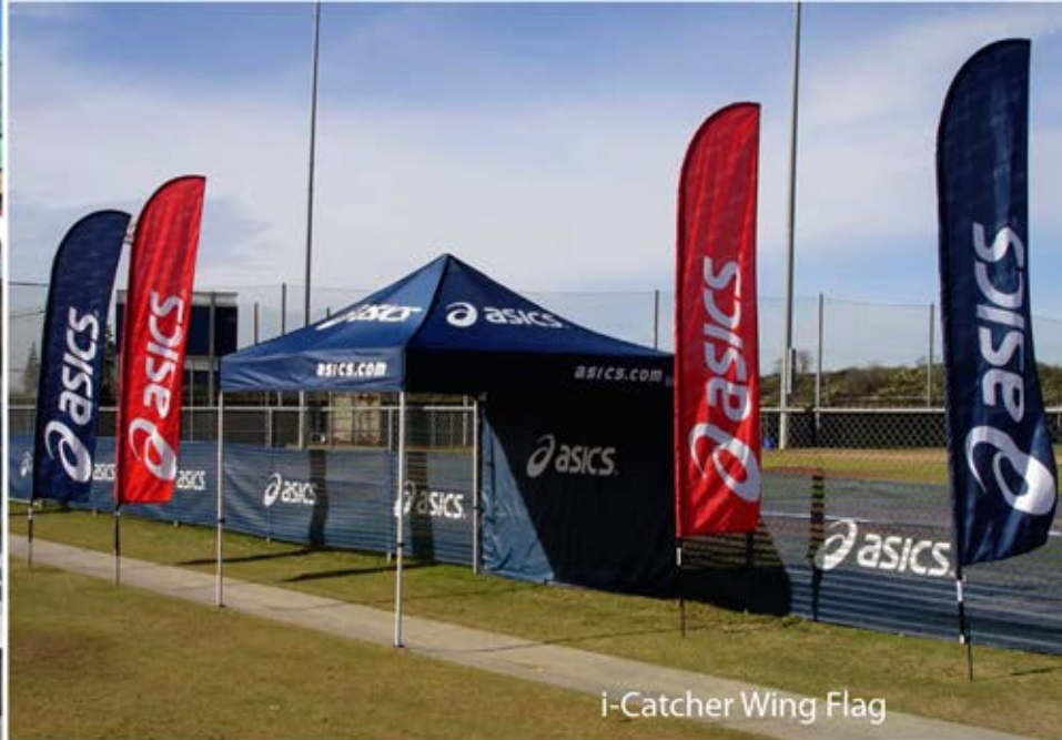
i-Catcher Wing Flag