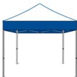
Cubierta personalizada sin diseño con picos blancos, cenefas azules y tendencias azules