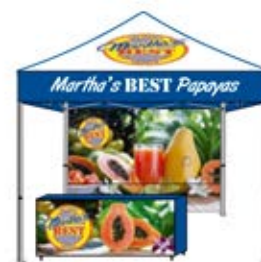
Cubierta personalizada con picos digitales, cenefas de color azul con logo & con tendencia azul. Pared digital & Lienzo frontal de mantel digital