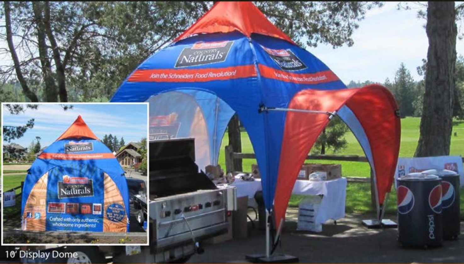
10' Display Dome