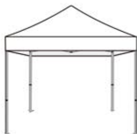
Una cubierta sin diseño simplemente blanca